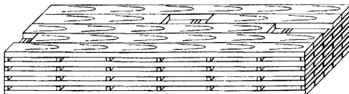
Рис. 1.3. Укладка пиломатериалов в ряду пакета или штабеля.

Допускается укладка в один пакет или штабель пиломатериалов, различных по длине, вразбежку. При этом длинные доски укладывают по краям пакета или штабеля, короткие – в середине. Стыкуемые пиломатериалы располагаются не менее чем на двух прокладках, при этом внешние торцы выравниваются по торцам пакета или штабеля (рис.1.3).